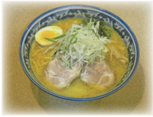
ラーメン (味噌)(塩・醤油)