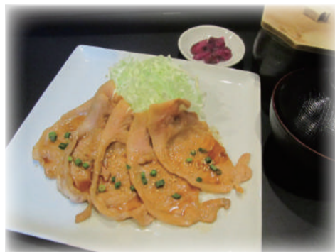
豚の生姜焼き定食