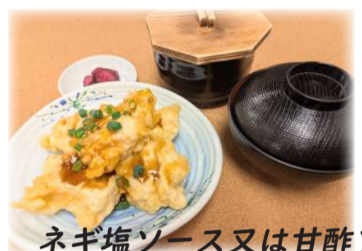
ネギ塩ソース又は甘酢ソース 唐揚げ定食 (おね肉)