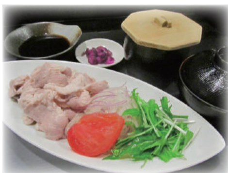
豚の冷しゃぶ定食