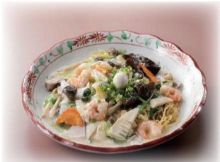
あんかけ塩焼きそば ¥1,250