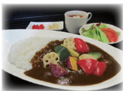
野菜と豚肉の ごろっとカレー ¥1,300