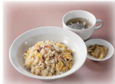
五目炒飯 ¥ 900