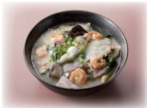
あんかけ塩ラーメン ¥1,150