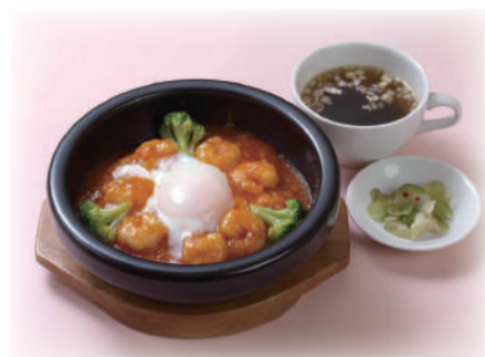
石焼きエビチリ丼 ¥1,150