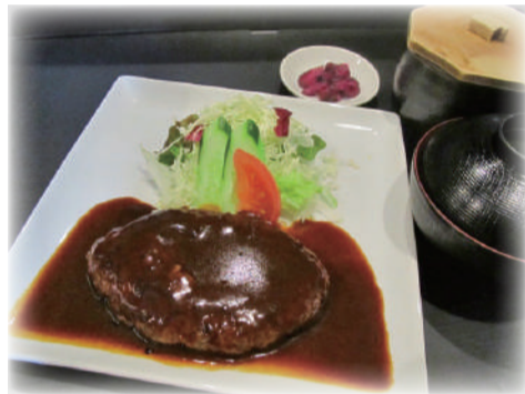
ハンバーグステーキ定食