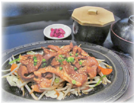
ジンギスカン定食