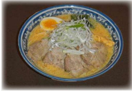
チャーシュー麺 (味噌)(塩・醤油)