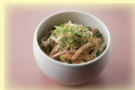
葱チャーシュー小丼