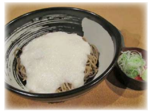
冷やしとろろそば