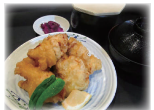
鶏むね肉の柚子胡椒揚げ定食