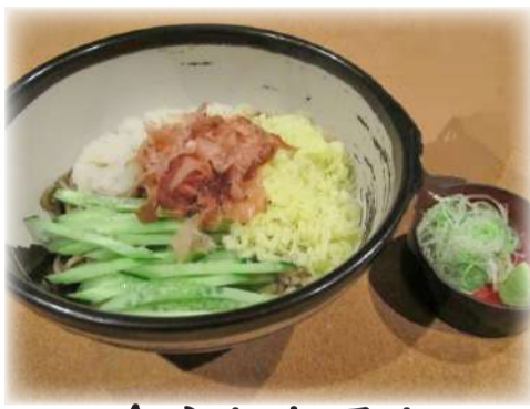
冷やしおろし たぬきそば