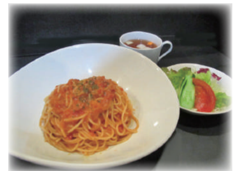
☆カニクリームパスタ